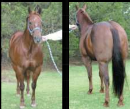
Photo avant et arrière

Cinq photos de base sont nécessaires : Avant, Arrière, Côté gauche, Côté droit et une vue de Devant trois quarts, qui sera la photo utilisée sur votre certificat d'immatriculation.